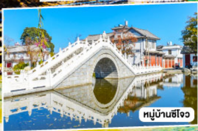
หมู่บ้านซีโจว