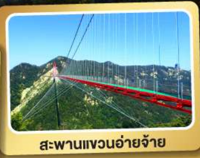
สะพานแขวนอ้ายจ้าย