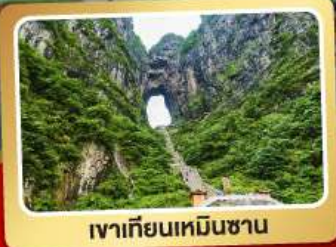
เขาเทียนเหมินซาน