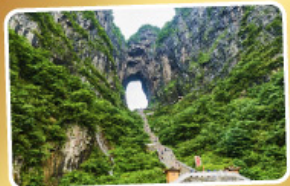
เขาเทียนเหมินซาน