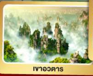
เขาวงตาร