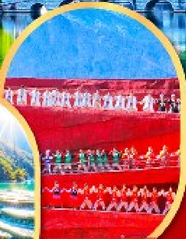
โชว์ Impression Lijiang