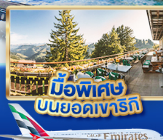
มือพิเศษ บนยอดเขารัก