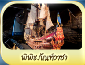
พิพิธภัณฑ์ทิวาชา