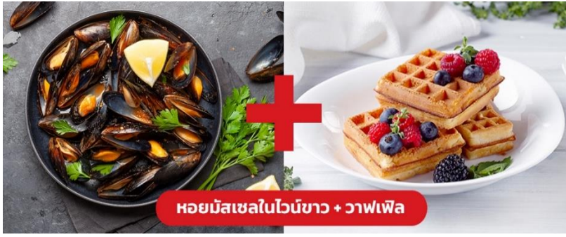
หอยมัสเซลในไวน์ขาว + วาฟเฟิล

เย็น ๑๐! รับประทานอาหารเย็น (มื้อที่10) เมนูพิเศษ!! หอยมัสเซล + วาฟเฟิล (Mussel in White wine + Waffle)