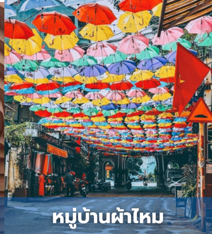
หมู่บ้านผ้าไหม