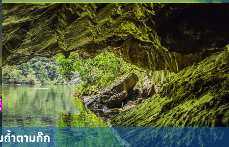
ล่องเรือชมถ้ำตามก๊ก