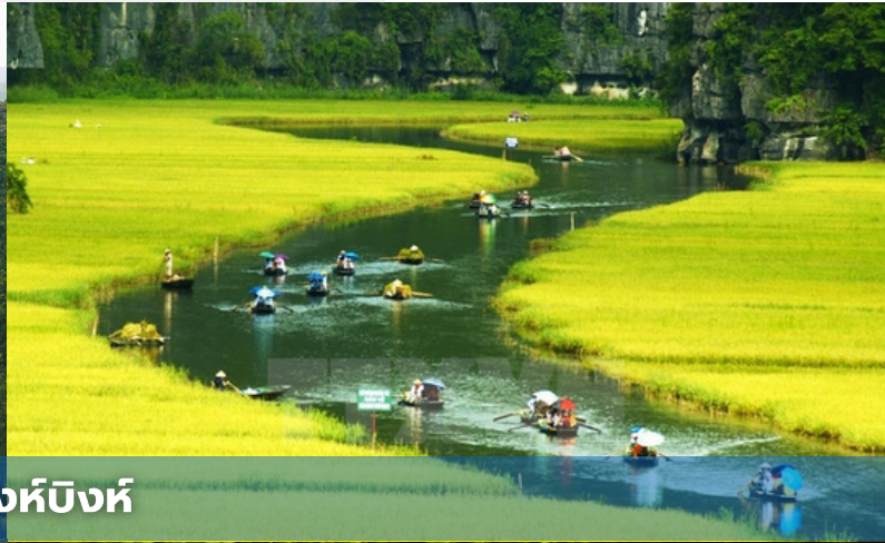
เมืองนิงห์บิงห์