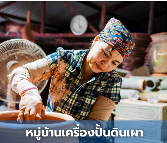
หมู่บ้านเครื่องปั้นดินเผา