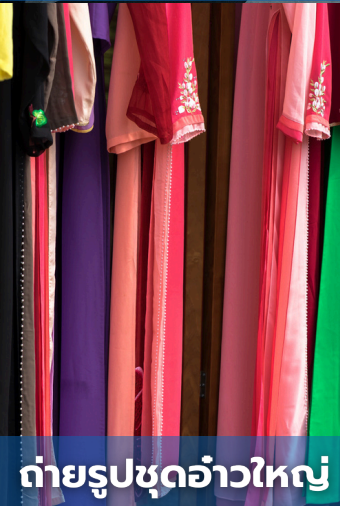
ถ่ายรูปชุดอ้าวใหญ่