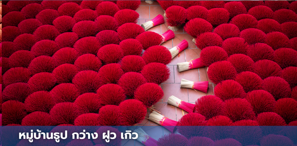
หมู่บ้านรูป กวาง ผู่ เกว