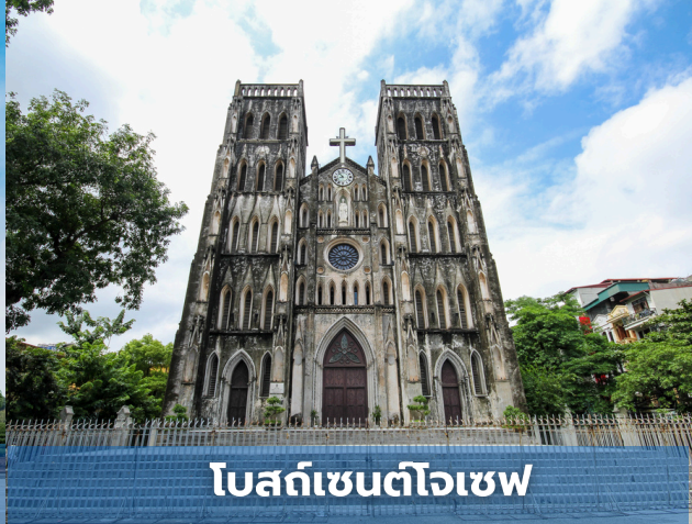
โบสถ์เซนต์โจเซฟ