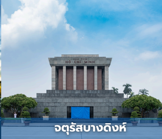
จตุรัสบางดิงห์