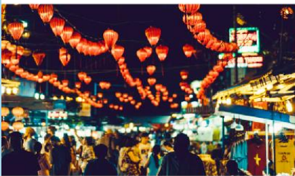
ตลาดกลางคืนญาจาง