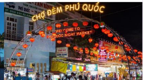
ตลาดกลางคืน

*ทางบริษัทฯ ขอสงวนสิทธิ์ในการสลับโปรแกรมทัวร์ตามความเหมาะสมขึ้นอยู่กับสถานการณ์หน้างาน โดยคำนึงถึงผลประโยชน์ของลูกค้าเป็นสำคัญ