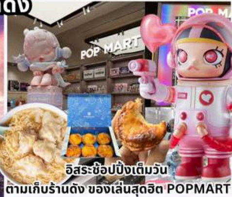
อิสระช้อปปิ้งเต็มวัน ตามเก็บร้านดัง ของเล่นสุดฮิต POPMART