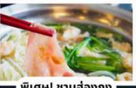
พิเศษ! ชาบูฮ่องกง