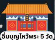
อิมบุนยไหว้พระ 5 วัด