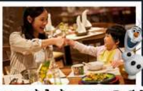
อาหารเข้าในห้องพักอาหารดิสนีย์