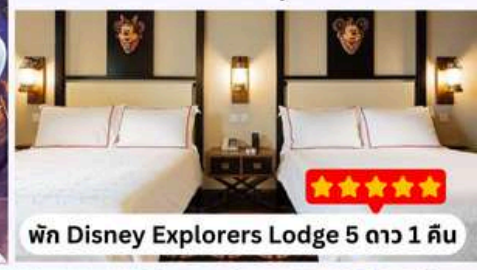
พัก Disney Explorers Lodge 5 ดาว 1 คืน