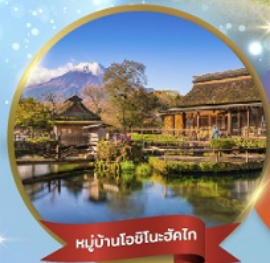
หมู่บ้านโอชิโนะอักษิโก