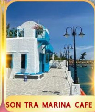
SON TRA MARINA CAFE