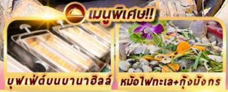
บุฟเฟ่ต์บนบานาฮิลล์ หม้อไฟทะเล+กุ้งมังกร