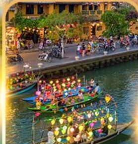
ล่องเรือลอยกระทง