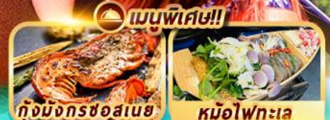
กุ้งมังกรชอสนเย