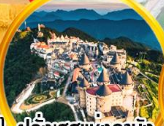
ฝรั่งเศษแห่งดานัง