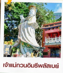
เจ้าแม่กวนอิมรพัสลเบย์