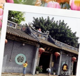
วัดกวนอูเซินเจิ้น