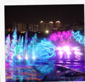
โชว์ม่านน้ำสามมิติ OCT BAY WATER SHOW

ไหว้พระขอพร 3 วัดดัง ชมดอกไม้หมู่บ้านฮอลแลนด์ ช้อปปิ้งย่านดัง ชมโชว์ม่านน้ำ OCT Bay Water Show