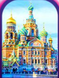
Church of The Spilled Blood