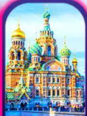
Church of The Spilled Blood