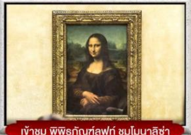
เข้าชม พิพิธภัณฑ์ลูฟวร์ ชมโมนาลิซ่า