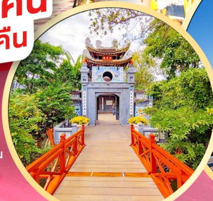
วัดหังอกเซิน