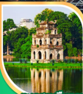
ทะเลสาบคินคาบ