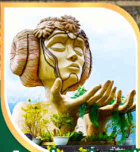
โมนำ ซาปา คาเฟ่