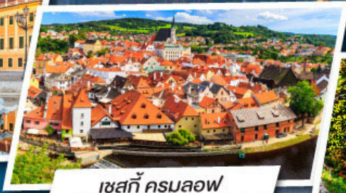
เชสกี ครุมลอฟ