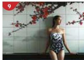
9 Crystal Life™ Spa Rejuvenate mind, body and soul with our holistic Western and Asian spa experience.