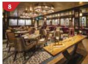
8 Bistro By Mark Best Relish contemporary Western cuisine from the internationally-acclaimed Australian chef.