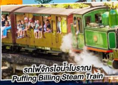
รถไฟจักรไอน้ำโบราณ Puffing Billing Steam Train