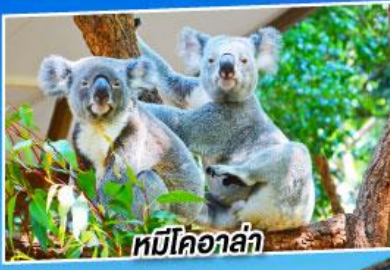
หมีโคอาล่า