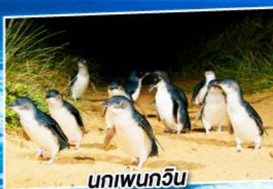
นกเพนกวิน