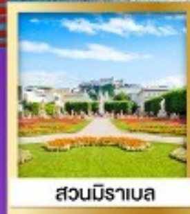
สวนมิราเบล