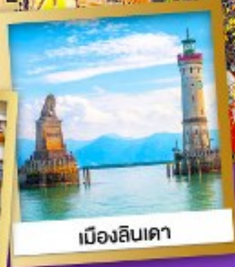
เมืองลินเคา