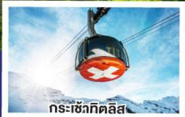
กระเช้ากิตติส

ฝรั่งเศส เบลเยียม เนเธอร์แลนด์ 10 วัน ลักเซมเบิร์ก สวิตเซอร์แลนด์ 7 คืน