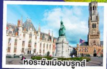
หอรบั้งเมืองบรูคส์