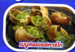
เมนูหอยออสการ์โท

ทานอาหาร ณ ภัตตาคารบนหอไอเฟล พร้อมชมวิวแสนโรแมนติก เมนูหอยแมลงภู่อุปไวน์ขาว