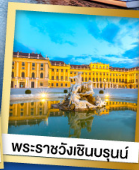
พระราชวังเซ็นบรุนน์