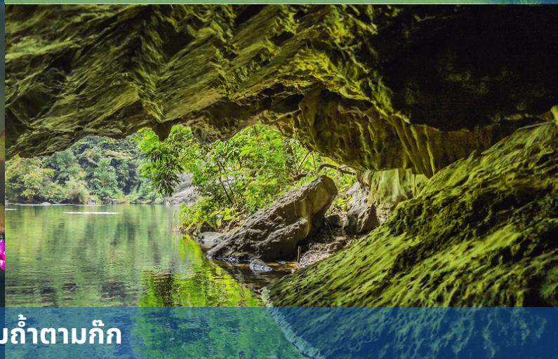
ล่องเรือชมถ้ำตามก๊ก