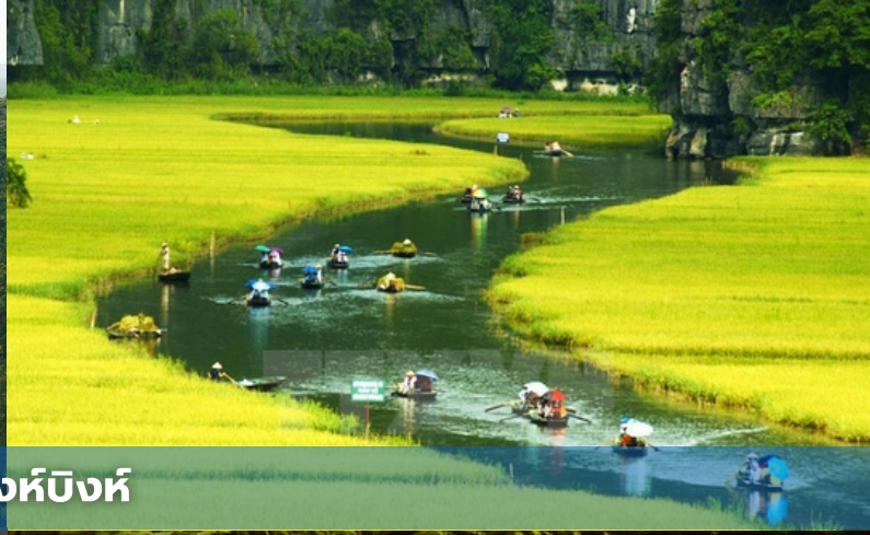
เมืองนิงห์บิงห์