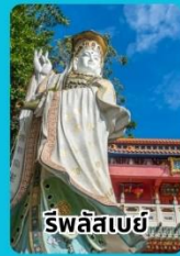
ริวัลลิสเบย์