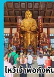
ไหว้เจ้าพ่อก้งหัน