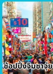
ช้อปปิ้งจิมซาฉุย