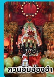
กวนอิมฮ่องกง