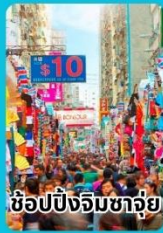
ช้อปปิ้งจิมซาจอย