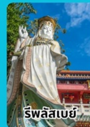
ริพลีสเบย์