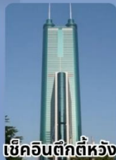
เช็กอินตึกตีห้วง