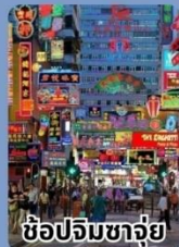
ช้อปปิ้งจางจู่ย