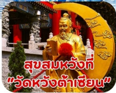
สุขสมหวังที่ "วัดหวังต้าเซียน"

*ราคาเริ่มต้นที่ 4,555.- บาท/ท่าน วันนี้-ธ.ค.67