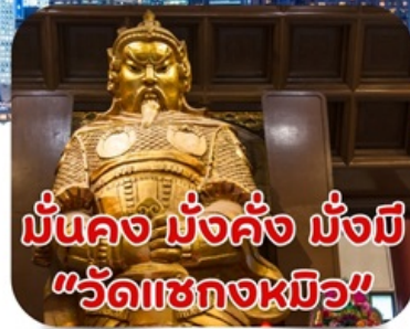
มันคง มั่งคั่ง มั่งมี "วัดเซกองหมิว"