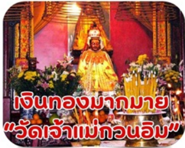
เงินทองมากมาย "วัดเจ้าแม่กวนอิม"