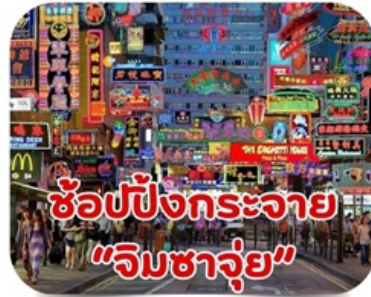
ช้อปปิ้งกระจาย "จิมซาจุ่ย"