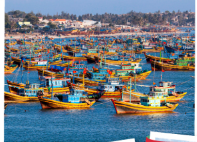
หมู่บ้านชาวประมงมุยเน่