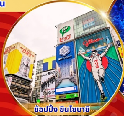
ช้อปปิ้ง ซินไซบาชิ