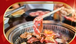
บุฟเฟ่ต์ปิ้งย่าง ไม่อั้น

KOREAN AIR บริการอาหารร้อน peach เอนเตอร์เทนเมนท์ฟรี