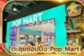
ตะลุยช้อปปิ้ง Pop Mart