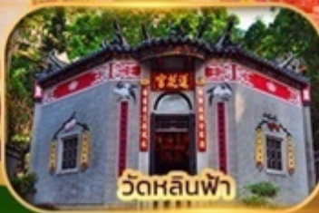
วัดหลินฟา