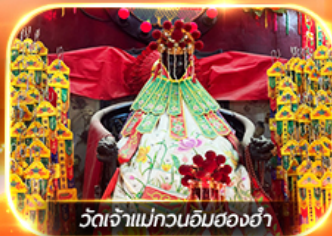
วัดเจ้าแม่ทวนอิมของฮ่า