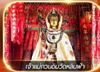
เจ้าแม่กวนอิมวัดหลินฟ้า