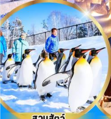
สวนสัตว์ อาซาฮิยาม่า