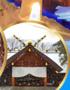
ศาลเจ้า ออกโทโต