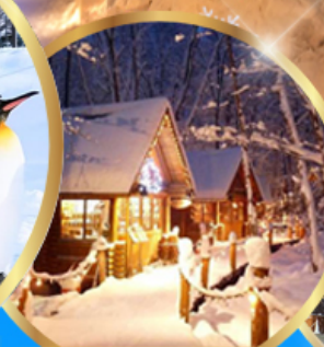
หมู่บ้านเทพนิยาย นิงเกิลทอเรส