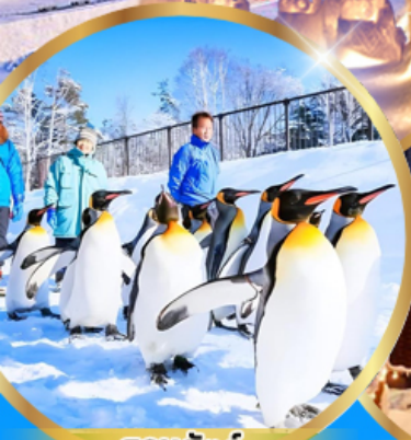
สวนสัตว์ อาซาฮิยาม่า