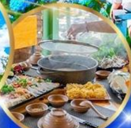
พิเศษ บุฟเฟ่ต์ 2 มือ