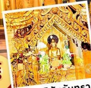
พระสุริยันจันทร