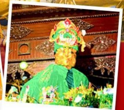
ขอพรแม่ยักษิ