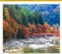
หุมาซึโองิ

ฮามะริมา / ไบโง / สวนทามาชิ / 50ฟุคุจิ / 50ฟุคุมิชิ / ปราสาทนินจา / ไบบะ / หุมาซึโองิ / ภูเขาฟูจิ โตะริะ ฮิโกะ / สวนโตะริะ / ฮิโงะมิซึรุจิ / 50ซาสึบุระ / ฮิโงะ พลาซ่า