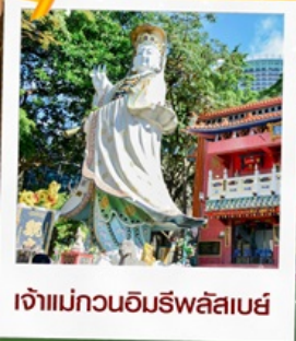
เจ้าแม่กวนอิมรพลัสเบย์