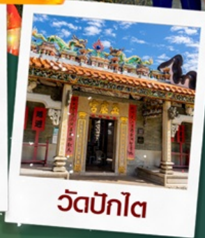
วัดปักไต่