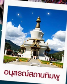
อนุสรณ์สถานทิมพู