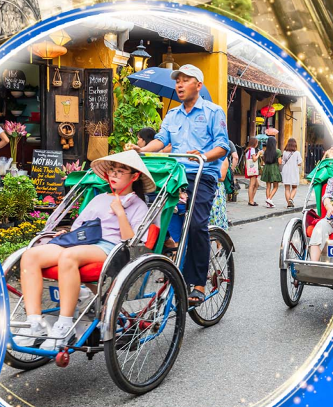
นั่งรถสามล้อซิโคล