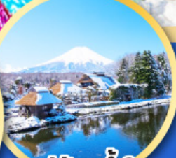
หมู่บ้านน้ำใส ไอชิโนะอัทสึ