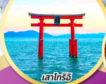
เสาโทริอิ