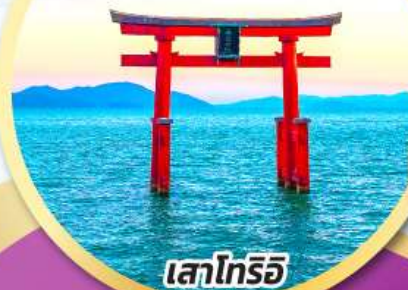
เสาโทริอิ