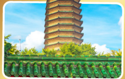
วัดพระเจี๊ยะเกี้ยว