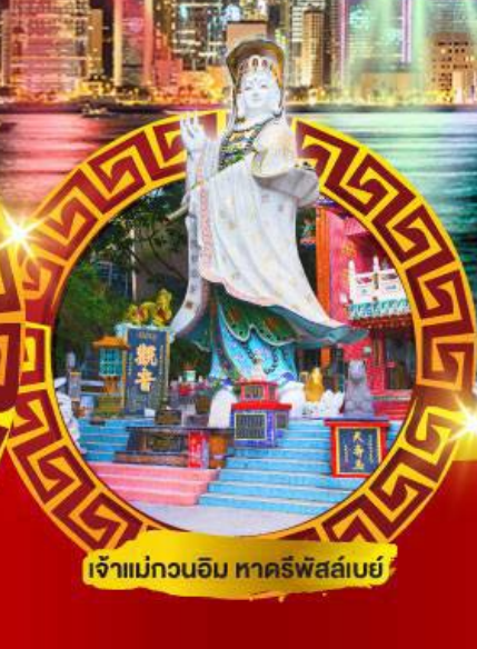
เจ้าแม่กวนอิม ทาครีฟส์ลีย์