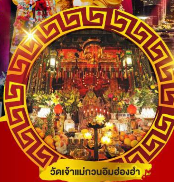
วัดเจ้าแม่กวนอิมฮ่องกง