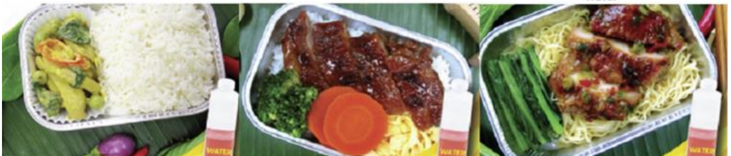
Chicken roasted with herb and noodle and water