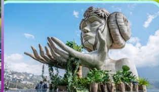
Moana Sapa Cafe