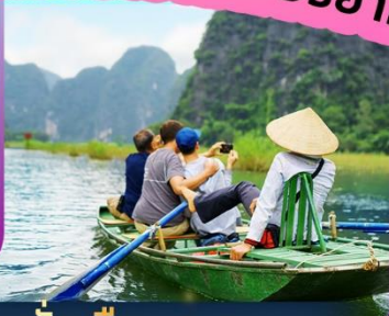
นั่งเรือกระจาด