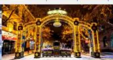
ถนนคนเดินจงหยาง