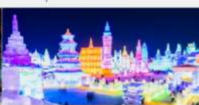
เทศกาลคอมไฟน้ำแข็ง

*ทางบริษัทฯ ขอสงวนสิทธิ์ในการสลับโปรแกรมทัวร์ตามความเหมาะสมขึ้นอยู่กับสถานการณ์หน้างาน โดยคำนึงถึงผลประโยชน์ของลูกค้าเป็นสำคัญ