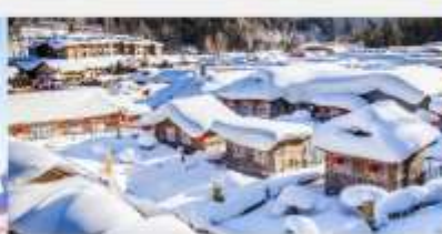
หมู่บ้านหิมะ