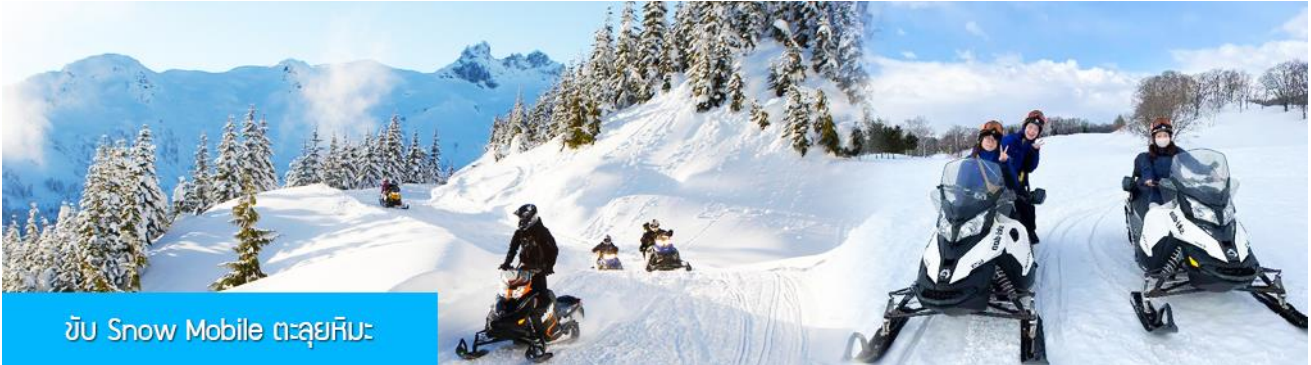
ขับ Snow Mobile ตะลุยหิมะ

ค่าบริการ ท่านละ 300 หยวน หรือ 1500 บาท อัตรานี้รวมค่าบริการผ่านเข้าอุทยาน ค่ารถรับ ส่ง และค่าบริการของไกด์ท้องถิ่น และค่าบริการจัดการของบริษัททัวร์ท้องถิ่น.....หมายเหตุ โปรแกรมเสริมเป็นโปรแกรมที่ท่านต้องเสียค่าใช้จ่ายเองด้วยความสมัครใจ สำหรับท่านที่ไม่เข้าร่วมกิจกรรมดังกล่าวสามารถนั่งพักในรถได้