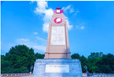
อนุสาวรีย์ฝิ่งหง

ชมและถ่ายภาพกับ รูปปั้นตึกตาทิมะยักซ์ 网红大雪人 เป็นตึกตาทิมะขนาดใหญ่ความสูง 18 เมตร ที่ทางเทศบาลเมืองฮาร์บินจัดทำขึ้นในช่วงฤดูหนาวของทุกปี เช่นเดียวกับการประดับต้นคริสต์มาสในช่วงเทศกาลของชาวตะวันตก จนกลายเป็นสัญลักษณ์แห่งฤดูหนาวของเมืองฮาร์บิน