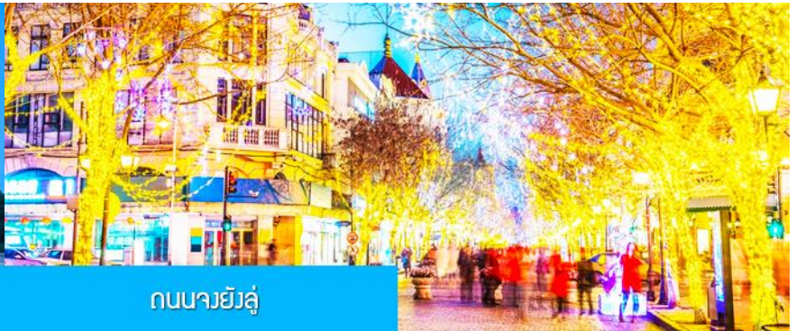
ถนนจงหยางต้าเจีย