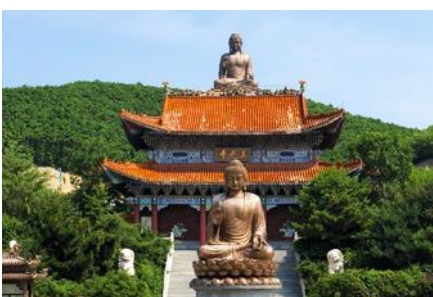
องค์พระพุทธรูปใหญ่จันทิว

พักที่ WAN HAO INTER HOTEL 4* หรือ โรงแรมในระดับเดียวกัน เมืองตุนฮว่า