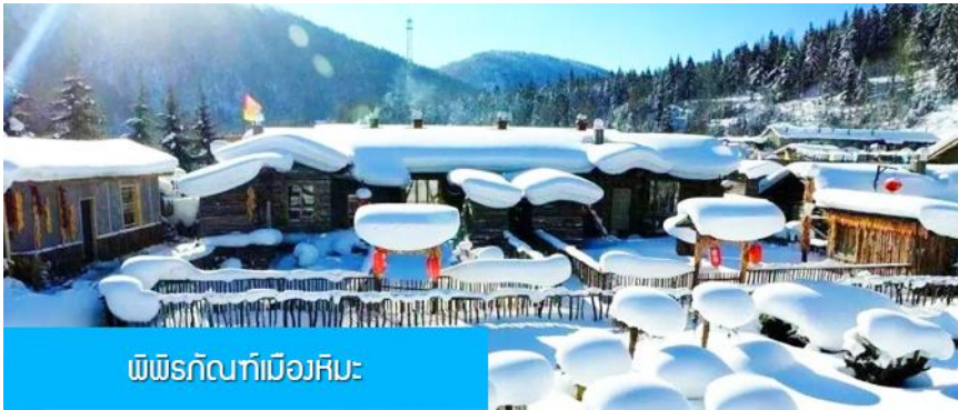
พิพิธภัณฑน์เมืองหิมะ:

พนักงานยกกระเป๋าจะมาคอยบริการยกกระเป๋าให้ผู้เข้าพัก ท่านควรจัดเตรียมกระเป๋าใบเล็กที่บรรจุเสื้อผ้า และเครื่องใช้จำเป็นสำหรับการพักผ่อน ณ โฮมสเตย์ในเมืองหิมะในคืนนี้ เพื่อสะดวกต่อการเคลื่อนย้ายกระเป๋า หมายเหตุ 2 ห้องพักในหมู่บ้านหิมะเป็นโฮมสเตย์ขนาดเล็ก เครื่องอำนวยความสะดวกและบริการอาหารมีค่าและมีค่าใช้จ่าย ไม่ทำเทียมกับโรงแรมในเมือง และมีอาหารในภัตตาคารได้ ท่านควรเตรียมผ้าเช็ดตัว แปรงสีฟัน ยาสีฟัน และเครื่องใช้ส่วนตัวที่จำเป็นนำติดตัวไปด้วย