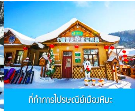
ที่ทำการไปรษณีย์เมืองหิมะ:

วันที่หก พิพิธภัณฑน์หมู่บ้านหิมะ-ที่ทำการไปรษณีย์หมู่บ้านหิมะ-เลือกซื้อโปรแกรมเสริมระเบียบภาพหิมะสิบลิ -เลือกซื้อโปรแกรมเสริม Snow Mobile Riding – เมืองฮาร์บิน