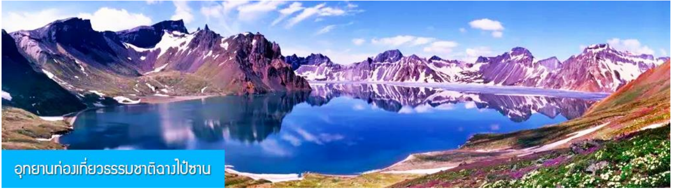
อุทยานท่องเที่ยวธรรมชาติฉางไป่ชาน