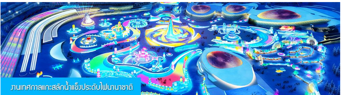
งานเทศกาลแกะสลักน้ำแข็งประดับไฟนานาชาติ

รับประทานอาหารค่ำ ณ ภัตตาคาร *เมนู สุกี้หม้อไฟ ปิ้งย่าง