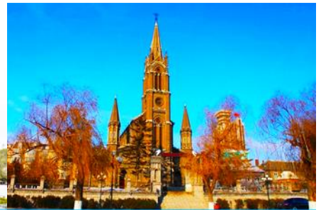
โบสถ์คอกอกอิก