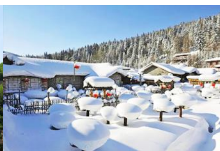
หมู่บ้านหิมะ